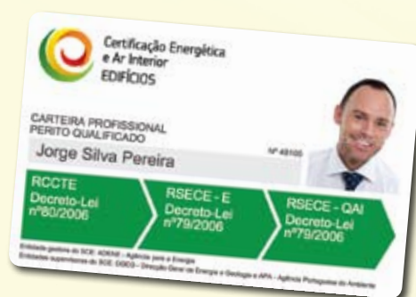
Cartão do Perito Qualificado

A peritagem deverá envolver sempre uma visita do próprio perito ao imóvel, para que possa verificar in loco a situação do mesmo e efectuar o diagnóstico necessário, identificando as oportunidades de melhoria do desempenho energético.